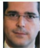
DIPLOMAZIA Sergio Vento: fu ambasciatore in Jugoslavia, Francia e Usa